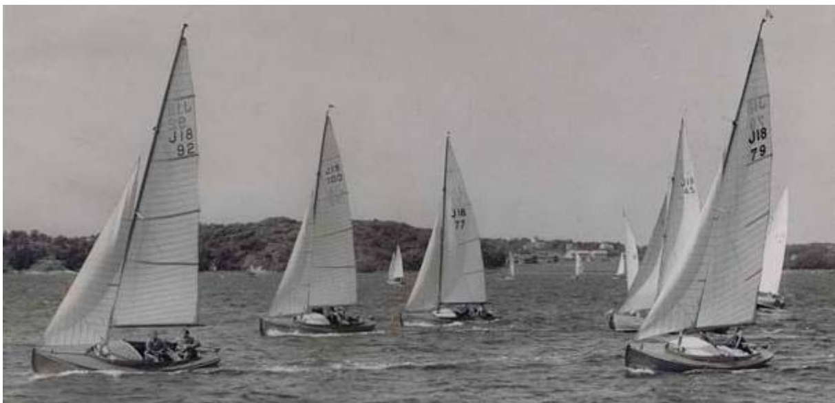
Kappsegling! J18 nr 92 ”Stardust” J18 nr 100 ”Puck” J18 nr 77 ”Tärnan” J18 nr 45 ”Raggen” J18 nr 79 ”Tampas” J18 nr 93 ”Lupo”