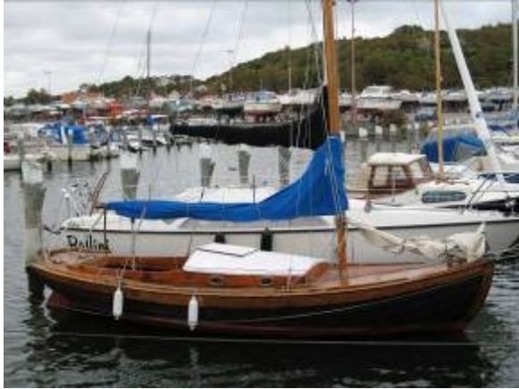
J22 nr 1 "Vindros" vid bryggan på Hinsholmen 2007