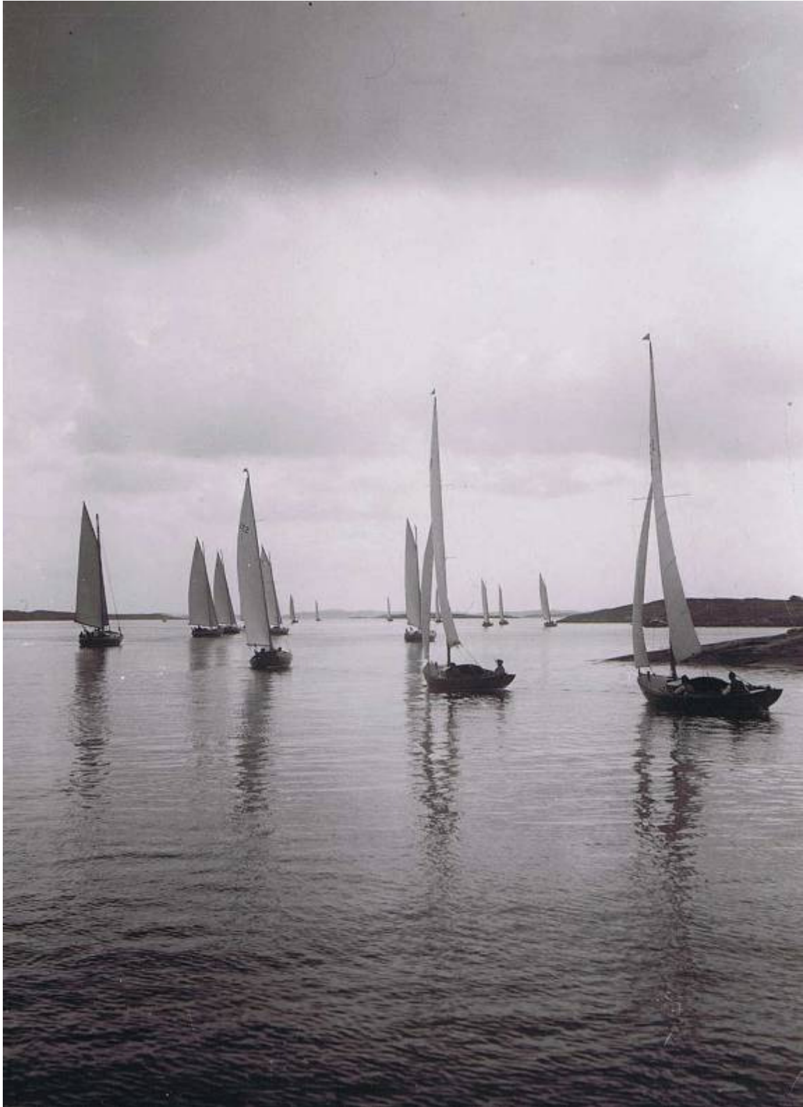
Kappsegling med Kostrar 1933 eller 1936. De tre jullarna är J22 nr 1 "Nabben II", årets J22-utlottningsbåt? och J22 nr 2 "Svanungen".