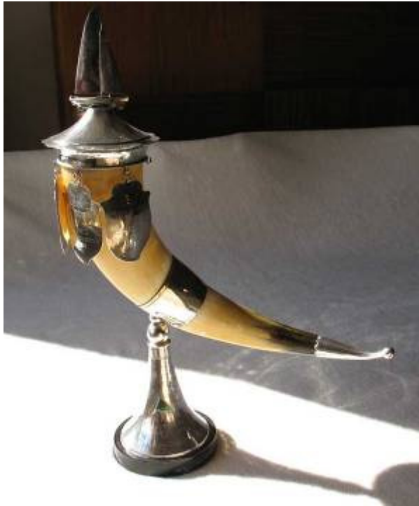
Jullepokalen ”Jullehornet” 1938-1944.