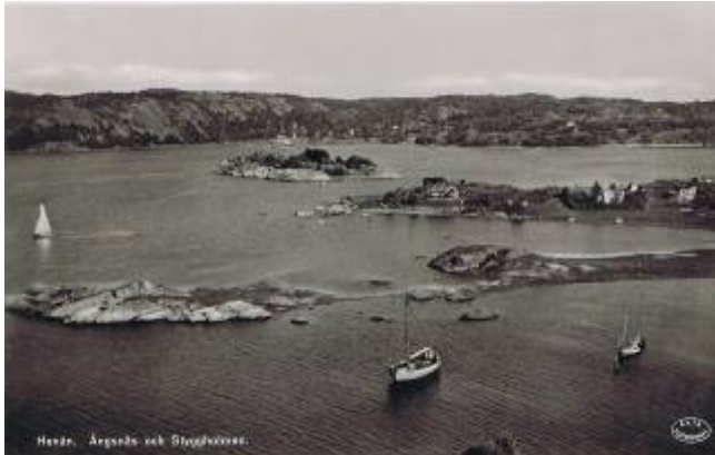
På ett gammalt vykort ligger jakten "Ingeborg" av Henån längst ned i mitten.