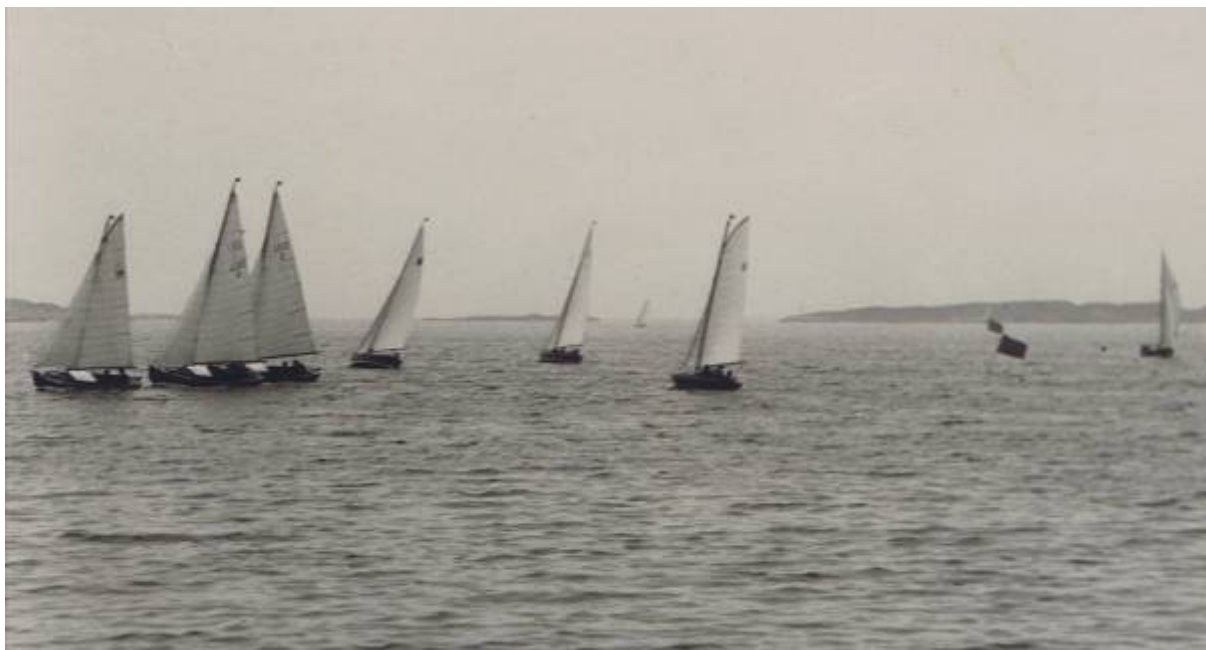
Kappsegling i Långedrag 1935? Starten har gått vid de röda flaggorna! Båtarna från vänster : J18? J22 nr 3 "Yar-Yar II" J22 nr 2 "Svanungen", J22 nr 5 "Skarven" utlottningsbåt i LSS 1935, J22 nr 1 "Nabben II", J18? (Den enda bilden på J18 med gaffelsegel?)