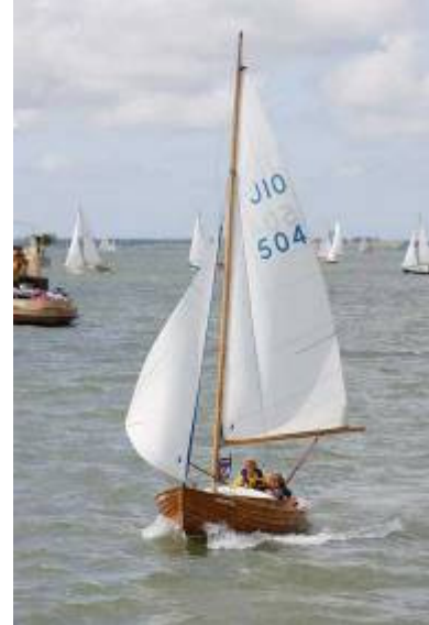
”Sirene” J10 nr 504 Kappseglar i Holland.