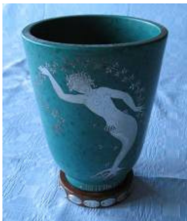
Jullepokalen 1945-54 Vinnare : J22 nr 33