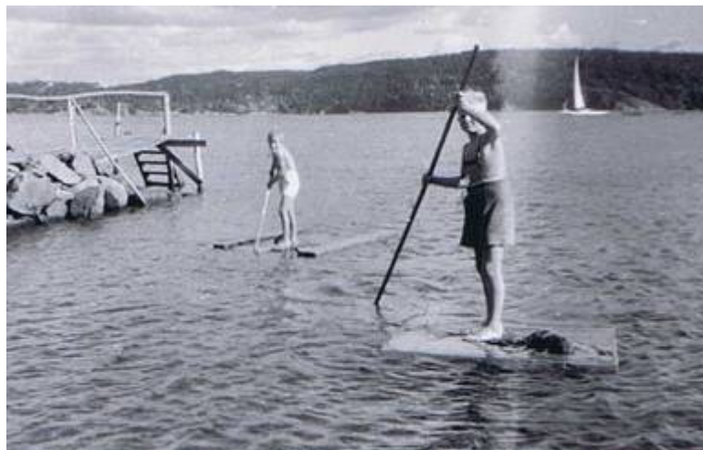
Bröder på flottar vid Rörvik, Byfjorden Uddevalla 1953