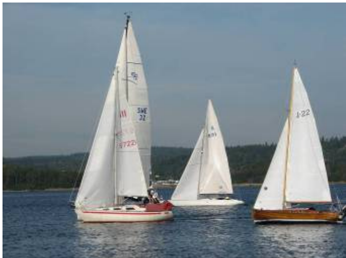
Kappsegling i SSVÄ, Byfjorden 2006 Th. J22 "Anna"

En båt med lite kortare mast, var bra för mig som otränad seglare. Premiärturen blev en två veckors familjesegling i Bohuslän med tursamt lätta vindar och sol varje dag! Det var den fina sommaren 1991. Vår båt "Anna" och Bohusläns vackra skärgård, fick oss att flytta tillbaka till barndomsstaden Uddevalla. Båten kom med åren att bli i möbelskick med förlängd mast och nya segel. Det blev kappsegling i Uddevalla SS Viken-Ägir , där jag som ende träbåtseglare i en armada av plastbåtar, försökte göra mitt bästa att inte alltid komma sist.