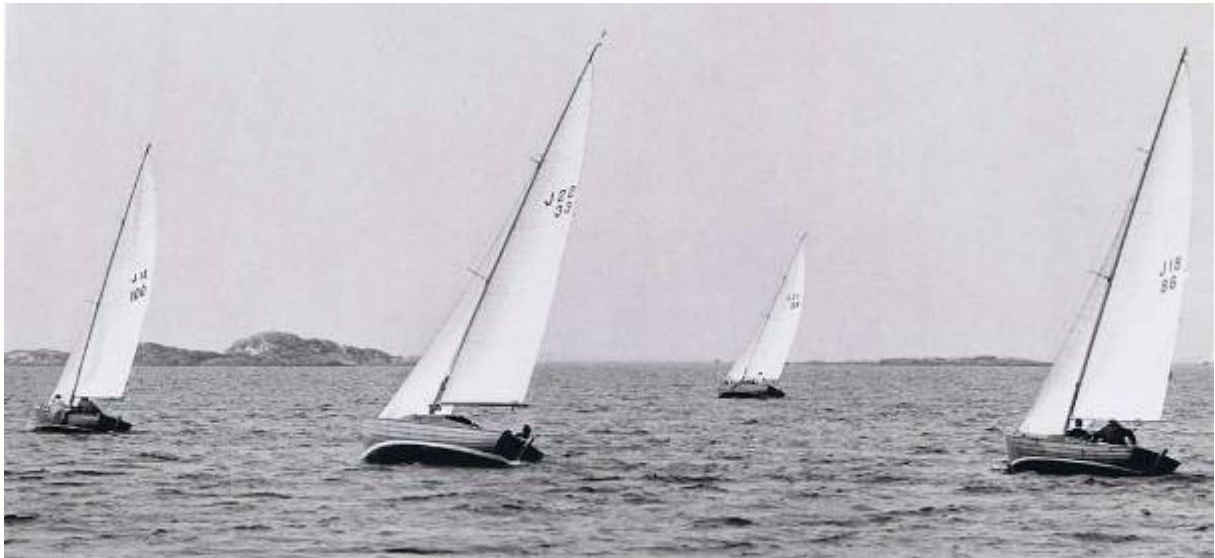
Kappsegling med J18 och J22 i Långedrag. J18 nr 100 "Puck" J22 nr 33 "Svanungen" J22 nr 36 "Gerana" och J18 nr 86 "Duchy"

Mellan dessa två kappseglingsbilder är det ungefär 50-60 år! Då, på 1950-talet fanns det bara träbåtar, nu i skrivande stund 2012 ser man nästan bara plastbåtar. För varje år minskar antalet träbåtar. Veteranbåtsklubbar som restaurerar träbåtar växer upp överallt. En träbåt tittar alla på och fotograferar, men en plastbåt är det ingen som ser på, oavsett hur dyr den är. Varför? Nostalgi? Längtan tillbaka? Träbåtar är sällsynta? Skönhetslängtan? Träbåtar är vackra? Färg? Blank fernissa på trä jämfört med vit plastyta? Trä som levande material? Många frågor!