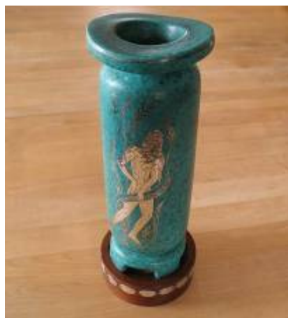
Jullepokalen 1955-63 Vinnare : J18 nr 100