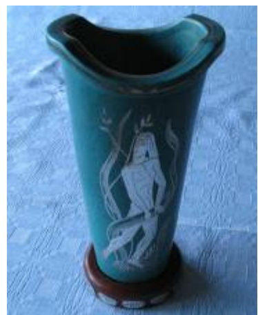
Jullepokalen 1964-69 Vinnare : J22 nr 33