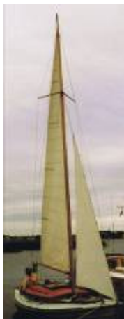
J22 "Anna" 1990