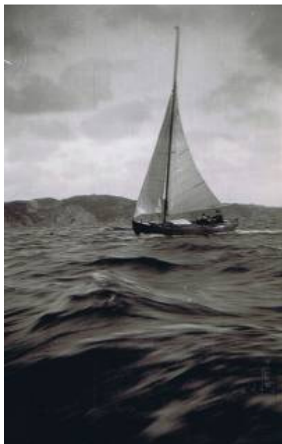
J22 nr 1 "Nabben II" på 1930-talet.