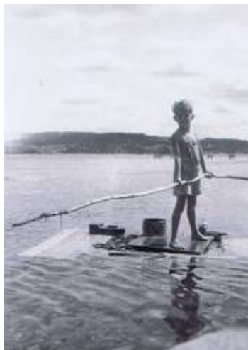
Författaren 7 år gammal 1951