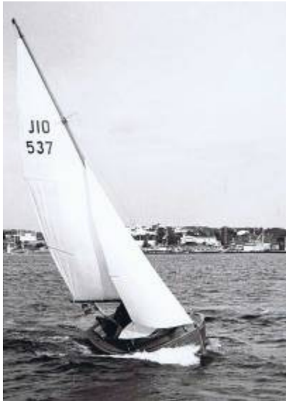
”Ankar-O-Lina” J10 nr 537 Full fart 1962.