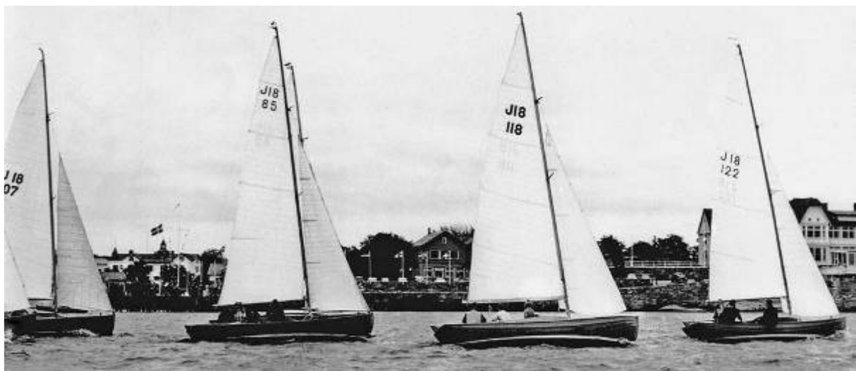
Kappsegling i Långedrag. J18 nr 107 "Katja" J18 nr 85 "Joker II" J18 nr 118 "Flamman" och J18 nr 122 "Stardust"