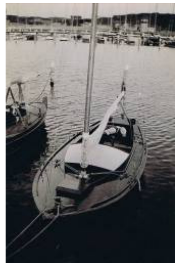
J22 nr 1 i Långedrag på 1930-talet.