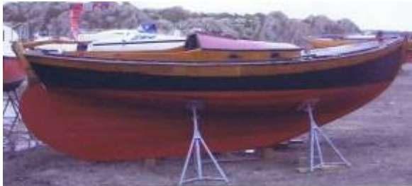
J22 nr 1 "Vindros" innan sjösättning 2007.