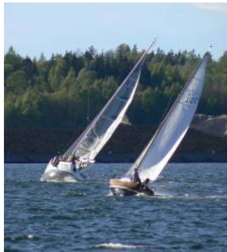
Onsdagssegling i SSVÄ 13 m/s